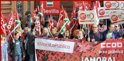
Concentración 24 noviembre