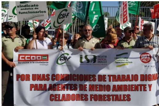
Concentración en Málaga.

En nota de prensa publicada por diversos medios, CCOO anuncia que va a convocar movilizaciones y a tomar todas las medidas a su alcance para que esta situación cambie y hace responsable directamente a la Consejería de cualquier daño a la seguridad y salud de Agentes de Medio Ambiente y Celadores Forestales.