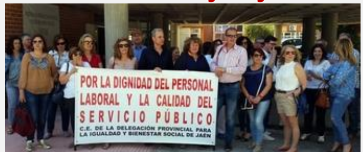
Concentración en Linares (Jaén)

En todas las provincias de Andalucía se vienen desarrollando movilizaciones y denuncias a la prensa sobre la situación en los centros dependientes de la Consejería de Igualdad debido a la falta de cobertura de vacantes y sustituciones en centros que acogen personas tan vulnerables como menores y personas mayores.