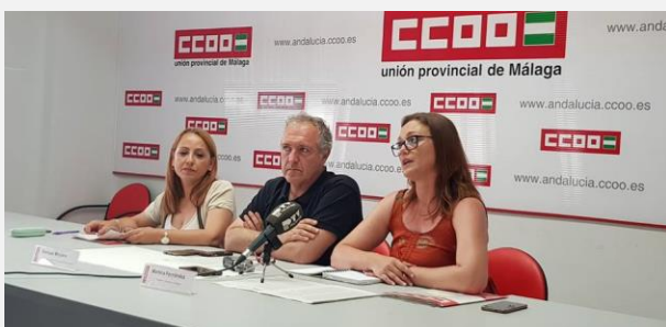
Rueda de prensa CCOO Málaga