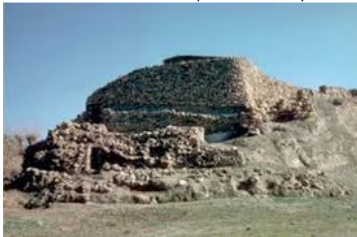
Yacimiento arqueológico Cerro de la Encina.

“El trabajo de empleados públicos es imprescindible para poder disfrutar del legado cultural que tenemos la fortuna de poseer”.