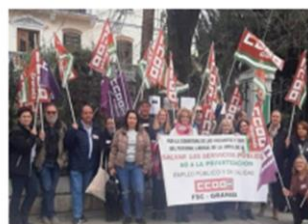
CCOO exige al Consejero de Cultura el cumplimiento de la L. Patrimonio y el acceso universal a la cultura

NEGOCIACIÓN de jornada de cuatro días semanales