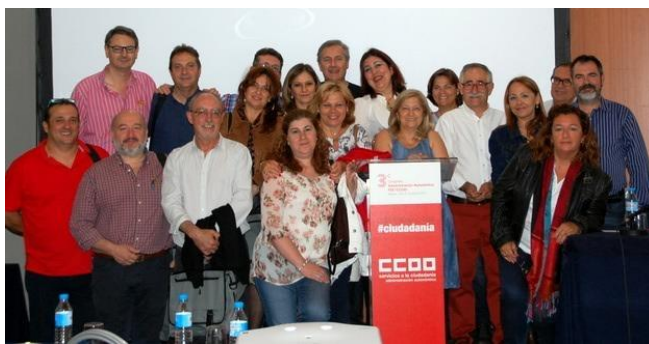
Delegación andaluza en el congreso.

Durante los dos días que ha durado el congreso, se han debatido las ponencias y los estatutos de la Federación y la Confederación de CCOO, que serán aprobados en los correspondientes congresos que tendrán lugar en las próximas semanas, y el Plan de Trabajo del Sector, presentado por la que iba a ser elegida como secretaria y que obtuvo un 98% del respaldo de las delegadas y los delegados.